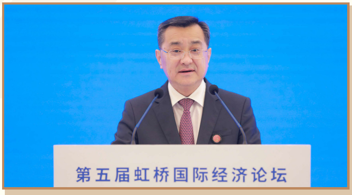
商务部部长助理李飞

在上海出席“深化产业园区和特殊经济区南南合作 加快实现包容和可持续发展”分论坛并致辞