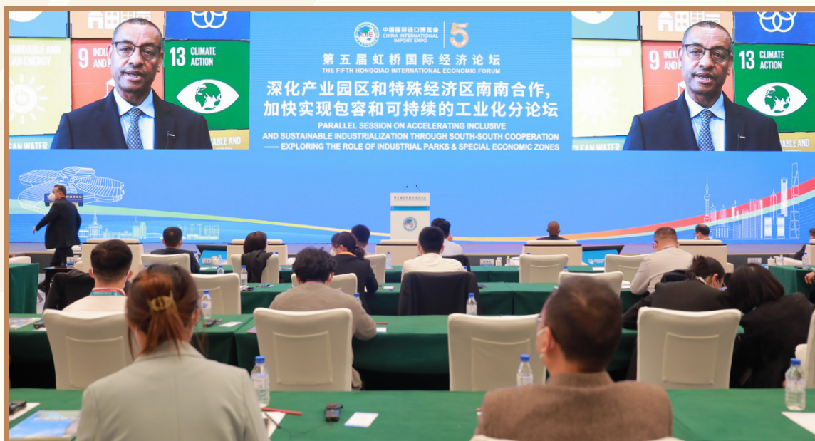
联合国工业发展组织农基产业和基础设施发展司司长德杰尼·特泽拉以视频方式出席“深化产业园区和特殊经济区南南合作加快实现包容和可持续发展”分论坛并参与成果发布