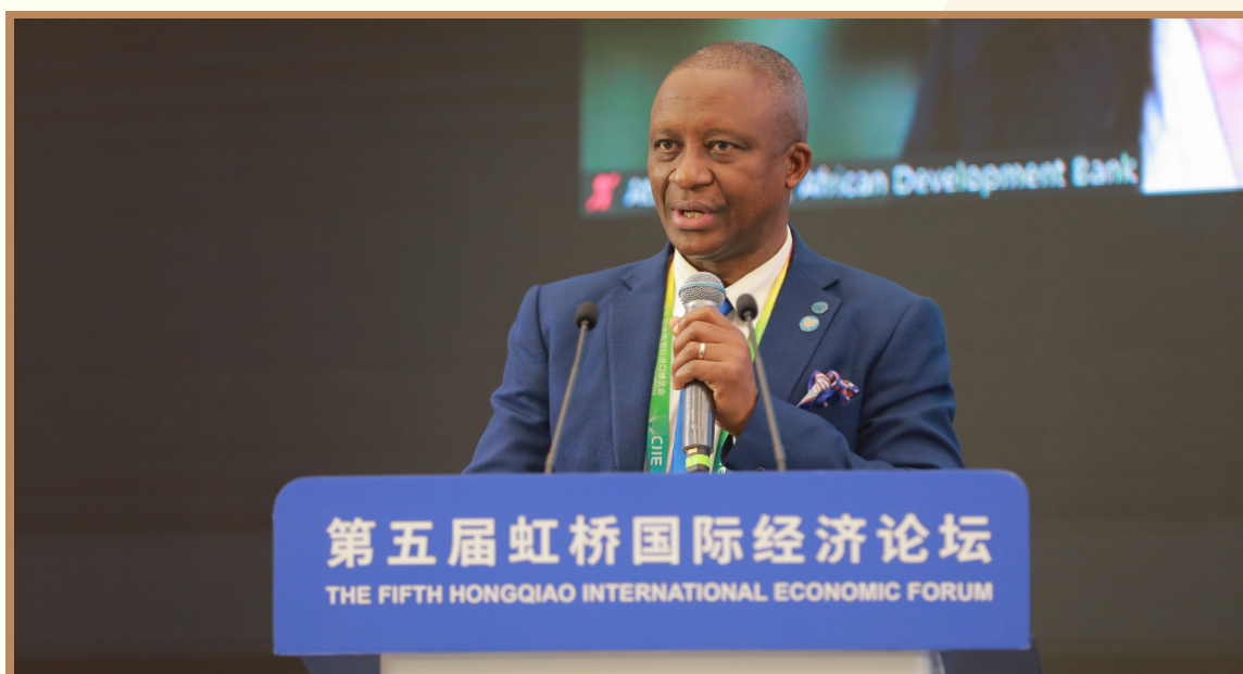
联合国工业发展组织区域（中国 / 朝鲜 / 蒙古）首席代表康博思 在上海出席“深化产业园区和特殊经济区南南合作 加快实现包容和可持续发展”分论坛并主持互动讨论环节