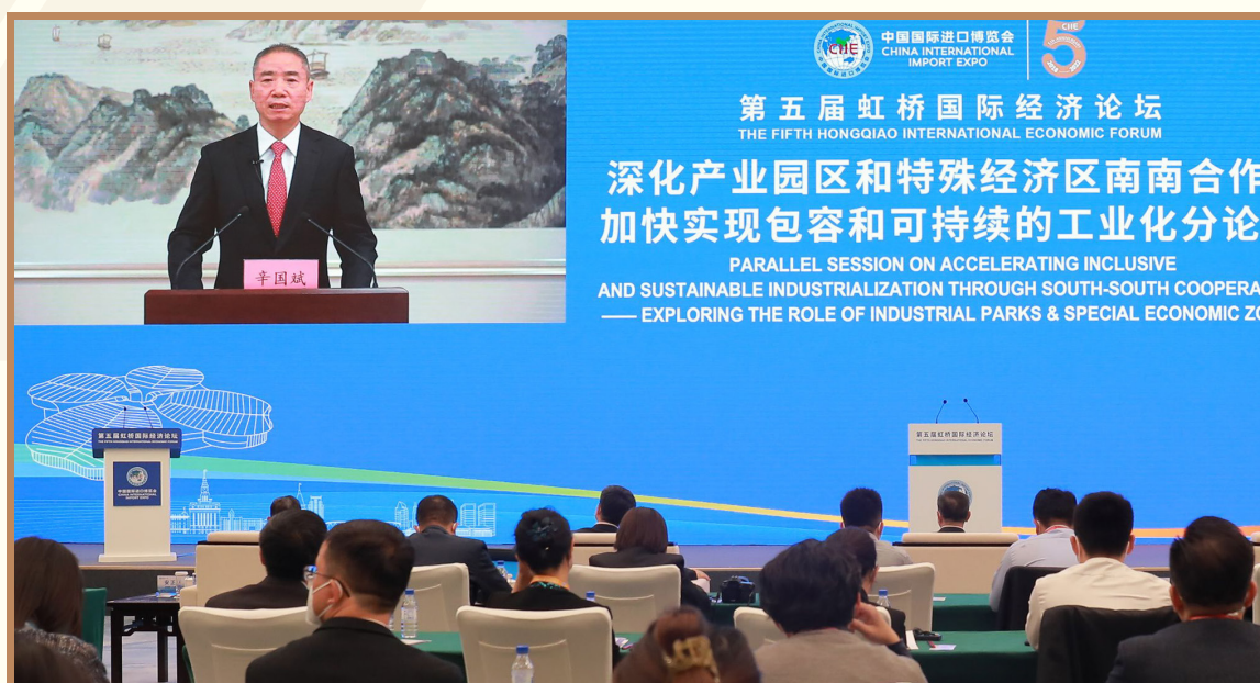
工业和信息化部副部长辛国斌

线上出席“深化产业园区和特殊经济区南南合作 加快实现包容和可持续发展”分论坛并致辞