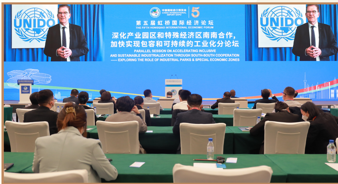
联合国工业发展组织总干事格尔德·穆勒 线上出席“深化产业园区和特殊经济区南南合作 加快实现包容和可持续发展”分论坛并致辞

联合国工业发展组织总干事格尔德·穆勒指出，当前中国在建设发展产业园区方面的丰富经验对其他发展中国家具有积极的借鉴意义。在当前形势下，需要促进对基础设施和创新的投入，加速推动工业化、数字化和绿色转型。工发组织将产业园区视为“支持可持续工业化的综合工具”，通过南南和三方合作等多种途径为成员国提供包括技术支持、政策咨询、知识和技术转让以及开发规范工具等一系列服务，支持工业园区标准化，并持续推动产业园区成为产业和技术创新的策源地。