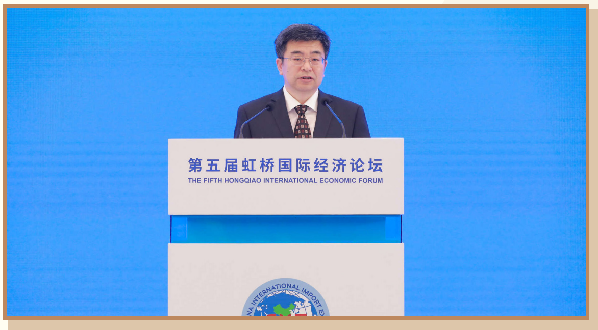
商务部外国投资管理司司长陈春江

在上海出席“深化产业园区和特殊经济区南南合作加快实现包容和可持续发展”分论坛并作主旨演讲