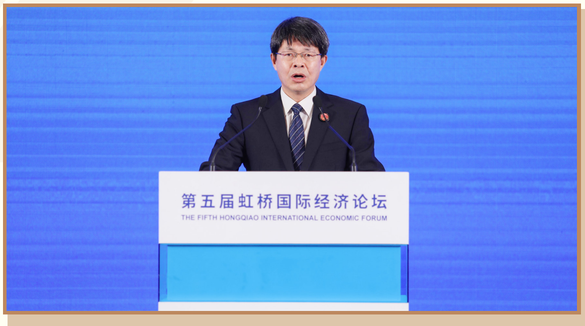
工业和信息化部党组成员、副部长张云明 在上海出席“践行企业社会责任 合作推进产业链可持续发展”分论坛并致辞

工业和信息化部党组成员、副部长张云明表示，当前世界进入新的动荡变革期，全球产业链供应链安全稳定畅通面临前所未有的挑战。维护全球产业链、供应链安全稳定畅通，是实现可持续发展的重要前提，也是新形势下企业社会责任的重要内容和应有之义。中国愿同各国政府和企业一道，把握新一轮科技革命和产业变革新机遇，合作推进全球产业链供应链绿色低碳发展，合作维护全球产业链、供应链韧性和稳定，合作培育全球产业链、供应链增长新动能，共同构筑安全稳定、畅通高效、开放包容、互利共赢的全球产业链、供应链体系，促进全球经济增长、增进各国人民福祉。希望各方加强沟通交流，凝聚共识，共同打造安全、稳定、畅通的全球产业链、供应链。