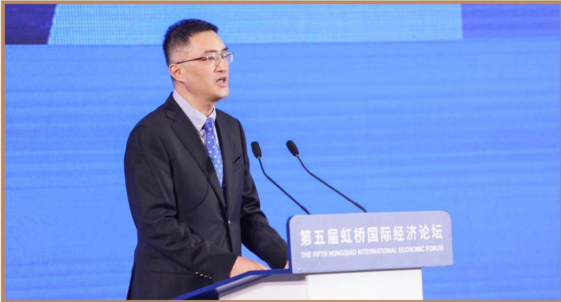
中央电视台财经频道主持人黄永东 主持“践行企业社会责任合作推进产业链可持续发展”分论坛