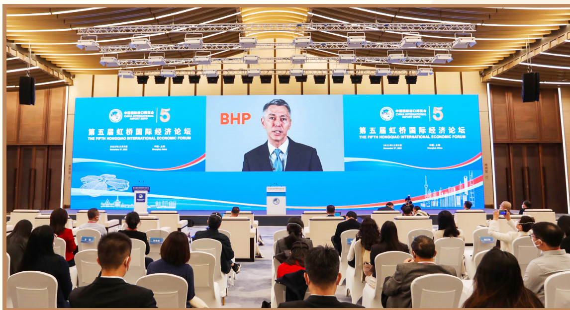
必和必拓首席执行官韩慕睿