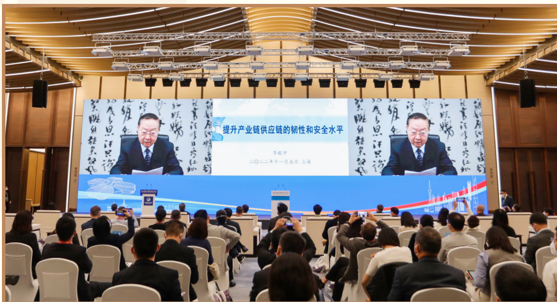
中国工业经济联合会会长李毅中 以视频方式出席“践行企业社会责任 合作推进产业链可持续发展”分论坛并作主旨报告

中国工业经济联合会会长李毅中围绕“提升产业链供应链的韧性和安全水平”，提出要加深对产业链供应链内涵的认知，把握国际大变局和国内新阶段下产业链供应链的新挑战新任务，增强产业链供应链韧性和安全水平。企业要做到更要推进整个产业链和供应链的绿色化、低碳化和数字化，从而保障产业链和供应链的安全、稳定，增强它的实力和韧性，这是企业在大变局、新阶段下，新的社会责任。李毅中会长在演讲中发布了《中国工业和信息化可持续发展报告 2022》和《中国工业和信息化绿色低碳发展报告 2022》。