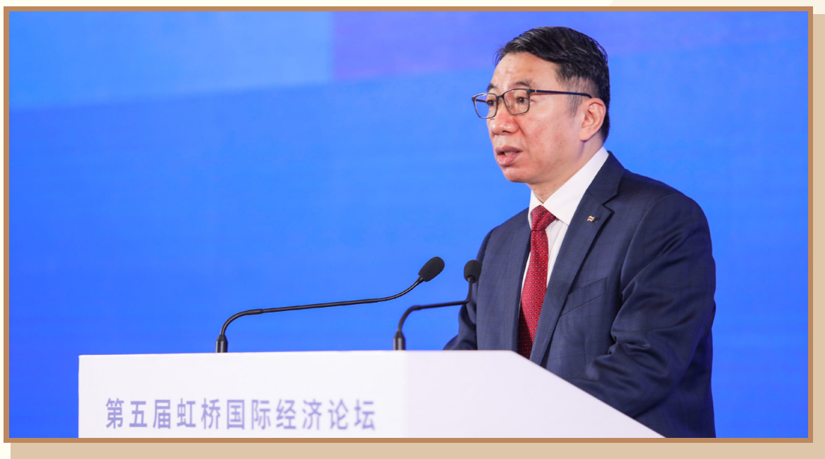
浦发银行董事长郑杨