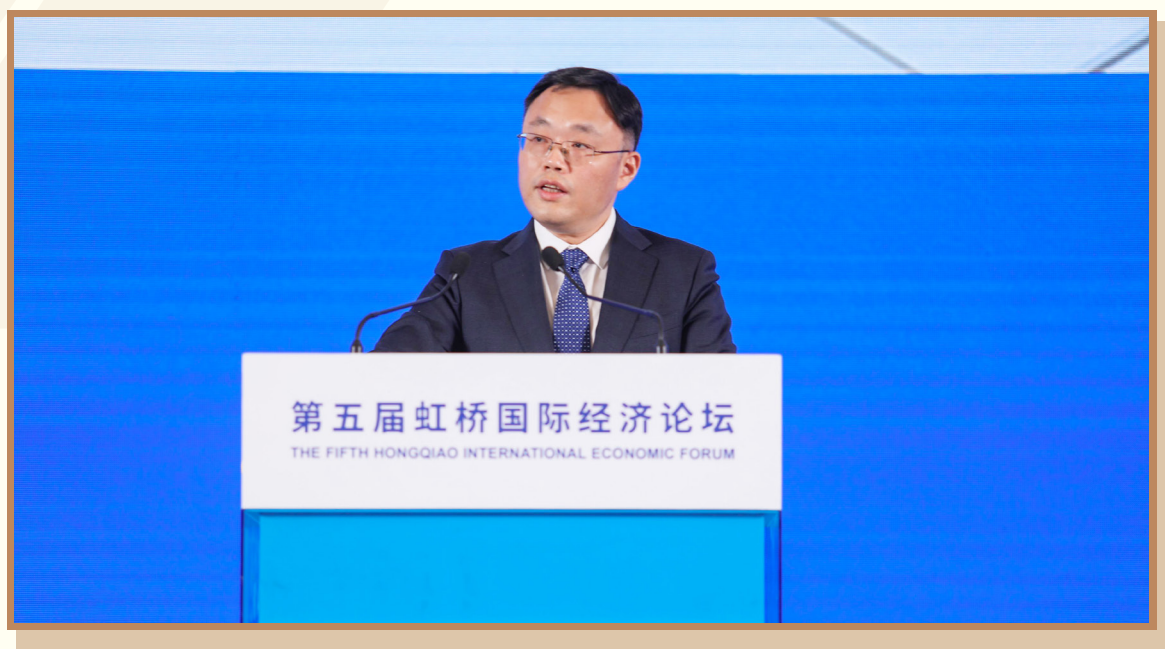
AMD 全球副总裁、AMD 中国研发中心轮值主席吉隆伟 在上海出席“践行企业社会责任 合作推进产业链可持续发展”分论坛并作主题演讲

AMD 全球副总裁、AMD 中国研发中心轮值主席吉隆伟介绍了 AMD 在推动可持续发展方面的行动与积极成果，阐述了环保举措如何跨越运营、供应链和产品。目前 AMD 正在推动四个战略重点，并定期对进展情况进行评估：一是数字化的影响；二是供应链责任；三是多样性、归属感和包容性；四是环境的可持续性。他表示，AMD 的目标是到 2030 年将运营中的温室气体排放量减少至少 50%。