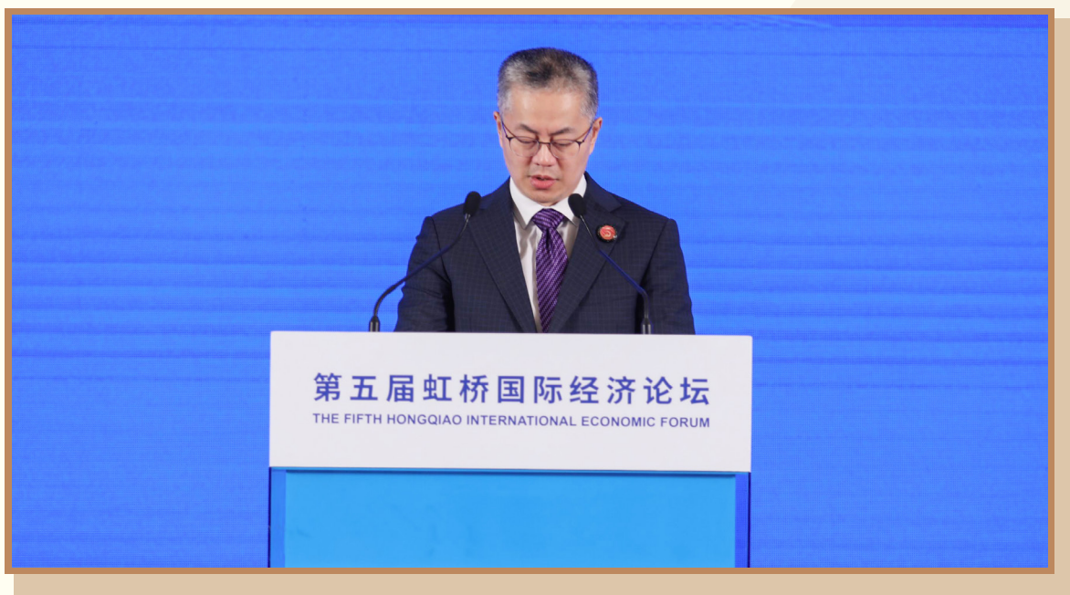
上海市委常委、副市长张为 在上海出席“践行企业社会责任 合作推进产业链可持续发展”分论坛并致辞

上海市委常委、副市长张为表示，近年来，上海重点发展集成电路、生物医药、人工智能三大先导产业，以及电子信息、生命健康、汽车、高端装备、先进材料、时尚消费品六大高端产业，取得了积极成效。上海市委、市政府将深入贯彻落实党的二十大精神，努力推进产业链供应链可持续发展。一是服务国家战略，发挥“政府有为、专班推进”+“市场主体、揭榜挂帅”机制作用，实施重点产业领域基础再造工程和重大技术装备攻关工程。二是突出创新引领，强化产业科技创新策源能力，聚焦产业共性需求打造创新联合体，加快打造重点产业增长引擎和高端制造业增长极。三是推动开放合作，支持企业积极参与全球和区域经济合作，承担经济社会发展应有责任。