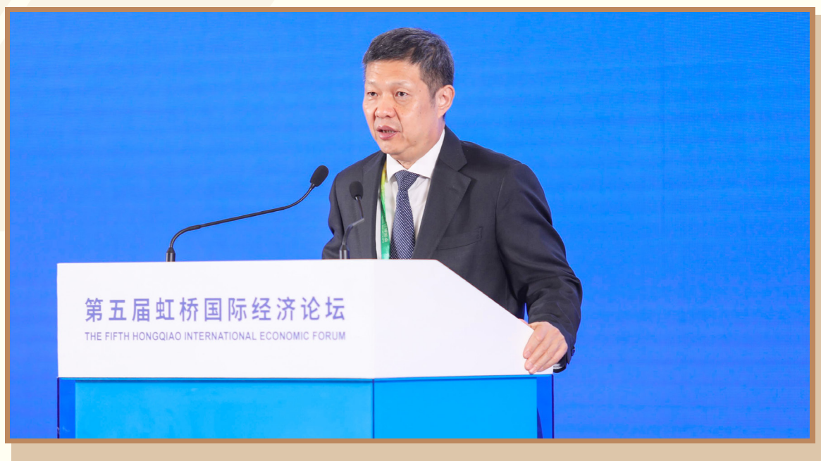
中国社会科学院经济研究所所长黄群慧 在上海出席“践行企业社会责任 合作推进产业链可持续发展”分论坛并作主旨报告

中国社会科学院经济研究所所长黄群慧发表了“以 ESG 投资践行新发展理念与全球发展倡议”的主旨报告。黄群慧表示，ESG 本身就是在践行新发展理念和全球发展倡议，也是企业高质量发展的方向。从宏观角度谈高质量发展，一般认为现在需要从创新驱动转向消费拉动。ESG 投资则完全可以把宏观的有效投资，转化为微观的企业 ESG 投资。ESG 投资有四个有效方向，同时也是践行新发展理念和全球发展倡议的实际方向，包括新型工业化的基础设施建设、高质量城镇化的基础设施、区域的发展以及加快制造业的发展。