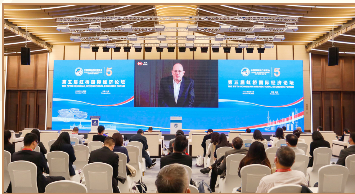
汇丰控股集团主席杜嘉祺