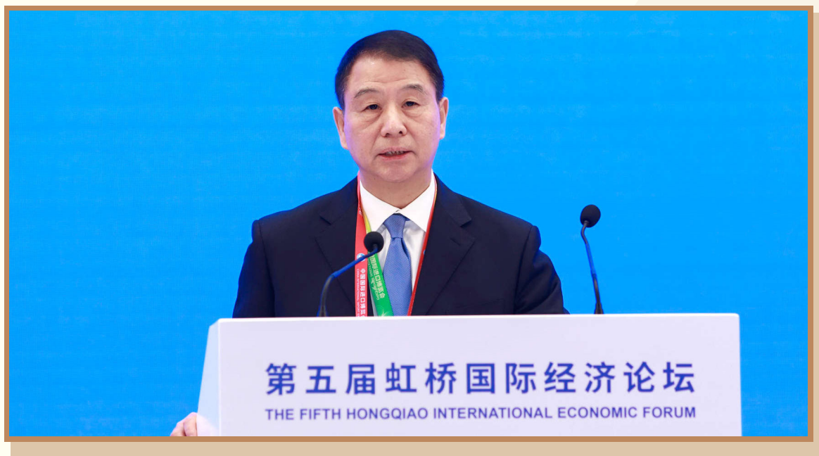
世界贸易组织原副总干事、商务部原副部长易小准 在上海出席“数字经济开放与治理”分论坛并作主旨发言

世界贸易组织原副总干事、商务部原副部长易小准指出，未来数字经济贸易规则谈判应重点关注：一是紧紧围绕可持续发展这一中心，还应在便利商业数据跨境流动与确保网络安全及个人信息保护之间实现平衡。二是灵活务实地在WTO中推动多边电子商务谈判。在多边规则制定中，应注意高标准、开放与包容性的平衡，鼓励和帮助后来者特别是发展中国家在条件成熟的时候加入。三是应鼓励私营部门积极参与。各国企业的不断创新和良好实践为制定与时俱进的多边贸易规则提供可靠依据和有力支撑。