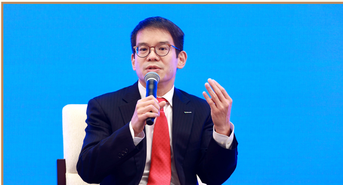
微软公司副总裁兼大中华区首席运营官康容 在上海出席“数字经济开放与治理”分论坛并参与互动讨论

微软公司副总裁兼大中华区首席运营官康容介绍了微软在发展数字经济方面的三条经验。一是重视数据的治理和管理。二是重视可持续发展，微软在国内跟远景能源、SGS 等合作伙伴推出可持续发展的解决方案。三是重视合规性，微软在超过 170 多个国家和市场提供合法合规的大数据和云服务。