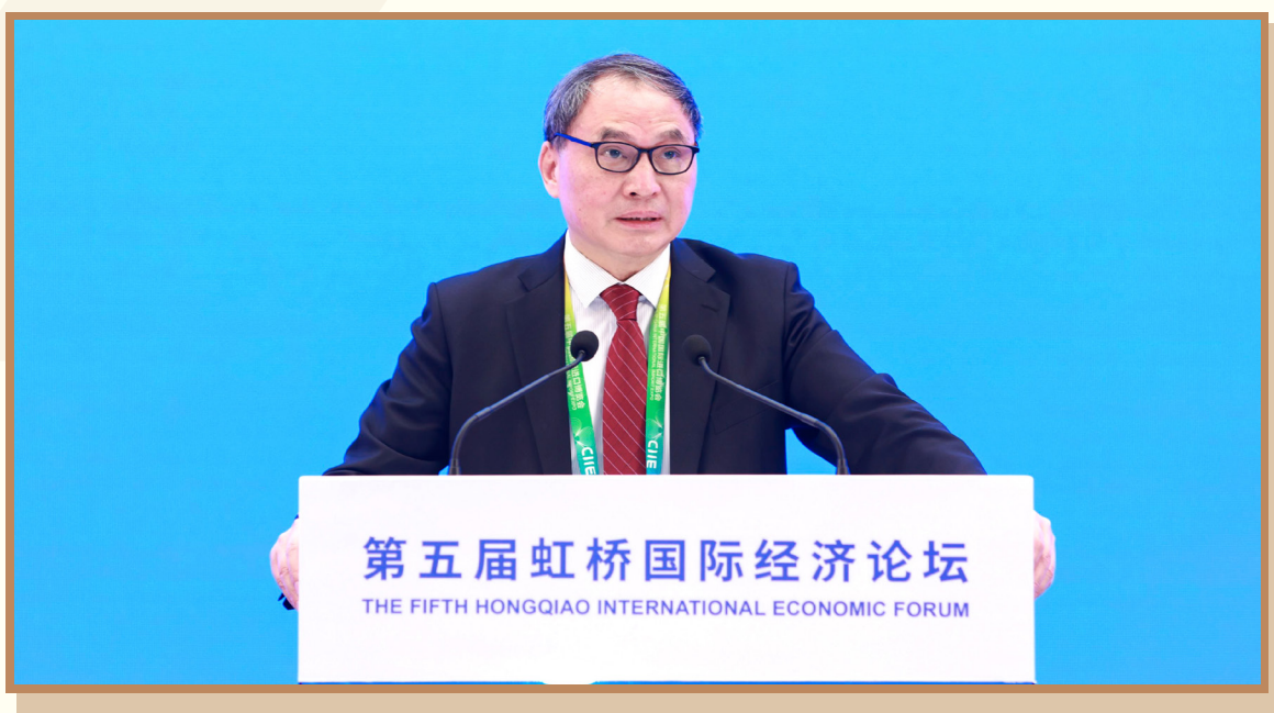
香港中文大学（深圳）教授、前海国际事务研究院院长郑永年 在上海出席“数字经济开放与治理”分论坛并作主旨发言

香港中文大学（深圳）教授、前海国际事务研究院院长郑永年认为，在数字文明时代，数字经济能否造福社会是影响大国竞争的重要因素。数字文明的良性发展，需要社会政治制度的引导与配合，需要适宜的制度环境，其中的关键在于平衡各方利益。过去 20 多年的信息技术革命，加快了西方中产阶级的衰落，这种衰落和社会贫富差距拉大导致的失衡是西方国家在数字文明时代面临的主要矛盾。对于中国来说，下一步最重要的问题是如何利用制度优势，在各个方面引领数字文明时代。数字化将从五个维度重塑人类社会：消费的数字化、产业的数字化、基础设施数字化、政府社会治理和服务的数字化、社会政治参与和个人权益维护的数字化。中国应在这五个维度全面发力。