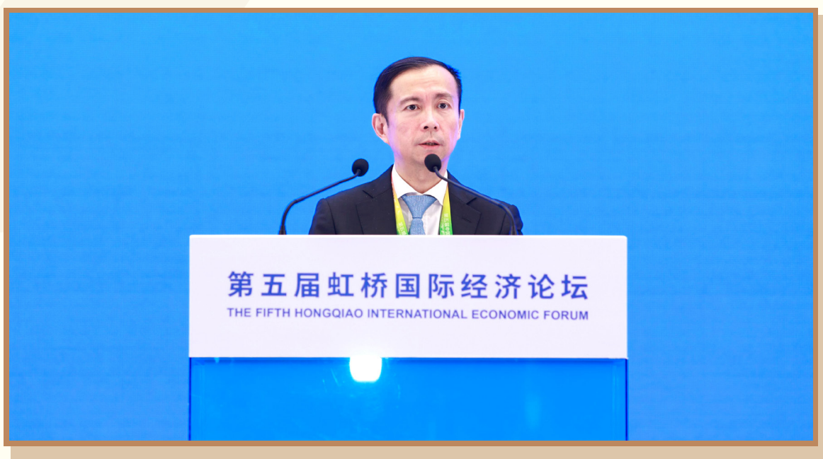
阿里巴巴集团董事会主席兼 CEO 张勇 在上海出席“数字经济开放与治理”分论坛并作主旨发言

阿里巴巴集团董事会主席兼 CEO 张勇表示，中国消费市场在过去二十多年快速发展，已经走在全球前列，率先实现了生活方式的数字化，消费数字化被绝大多数人所接受。这对全球客商而言是巨大机遇，企业无论规模大小，只要商品好，就有机会通过数字化方式进入中国市场，分享中国市场的巨大潜力。