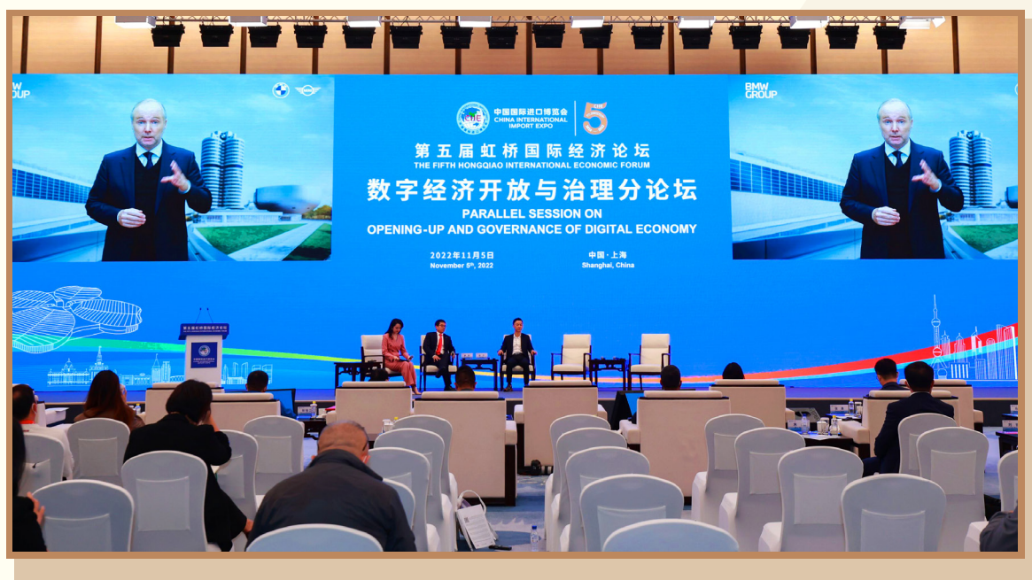
宝马集团大中华区总裁兼首席执行官高乐 以视频方式出席“数字经济开放与治理”分论坛并参与互动讨论

宝马集团大中华区总裁兼首席执行官高乐强调在数字经济发展中要做好数据管理，更好地使用消费者数据。只有在中国市场做好各个方面的调控和配合，包括从上至下每一个环节都要不断确保实现数字化，才能更好推进数字经济以及数字化技术的发展。