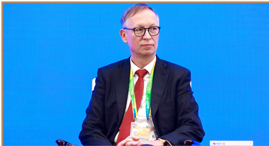
上海诺基亚贝尔首席执行官、诺基亚大中华区总裁马博策 在上海出席“数字经济开放与治理”分论坛并参与互动讨论

上海诺基亚贝尔首席执行官、诺基亚大中华区总裁马博策表达了他对元宇宙的看法。工业元宇宙是由企业以及实际需求所驱动的。所有这一系列的元宇宙技术一定是基于非常稳健的网络系统的构建，我们将会看到越来越多的专业网络供应商的出现，不断满足工业等级的需求。