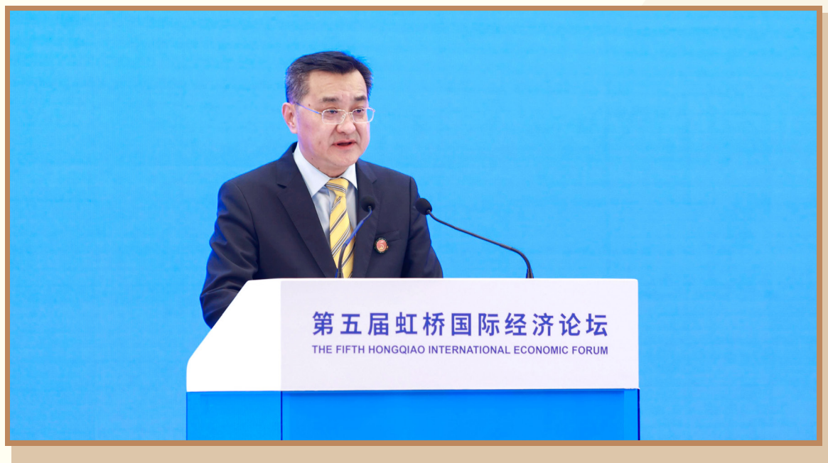
商务部部长助理李飞 在上海出席“数字经济开放与治理”分论坛并致辞

商务部部长助理李飞指出，中国政府高度重视数字经济开放、治理和国际合作。商务部将深入学习贯彻党的二十大精神，完整、准确、全面贯彻新发展理念，服务构建新发展格局。一是推进高水平对外开放。做好数字贸易顶层设计。二是完善数字经济治理体系。推动健全法律法规和政策制度，完善体制机制，提高数字经济治理体系和治理能力现代化水平。三是推动数字经济国际合作。积极参与世贸组织电子商务谈判，维护和完善多边数字经济治理体制，推动达成各方普遍接受的规则。