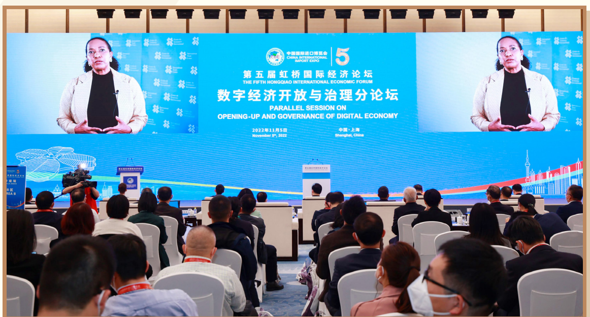
国际贸易中心执行主任帕梅拉·科克 - 汉密尔顿 以视频方式出席“数字经济开放与治理”分论坛并致辞

国际贸易中心执行主任帕梅拉·科克 - 汉密尔顿表示，数字互联互通对实现联合国可持续发展目标的影响日益剧增，对促进就业和经济高速发展也有贡献。全球互联统计显示，2020年，全球GDP的三分之一通过数字贸易实现。世贸组织预测，由于数字技术，全球贸易将会在十年里每年增长2%，但是数字鸿沟问题急需解决。国际贸易中心将支持发展中国家微小中企业参与数字经济。