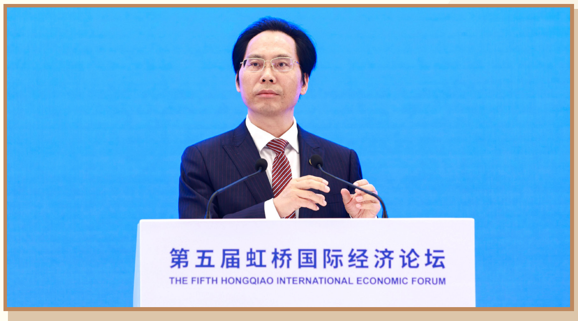
浙江大学副校长黄先海 在上海出席“数字经济开放与治理”分论坛并作主旨发言

浙江大学副校长黄先海认为，数据要素成为全球的新型生产要素，但是数据跨境流动和全球规则尚未形成。作为数字经济强有力的支撑，数据作为要素在全世界的流动还受到规则限制，需要进行规则突破。中国未来要对标或对接世界最高水平的经贸规则，甚至要成为全球数字经贸规则的建构者和引领者。目前中国在有序推动数据跨境流动、扩大跨境服务贸易开放、促进数字贸易便利化等方面不断进行探寻，致力于营造良好的数字贸易营商环境。