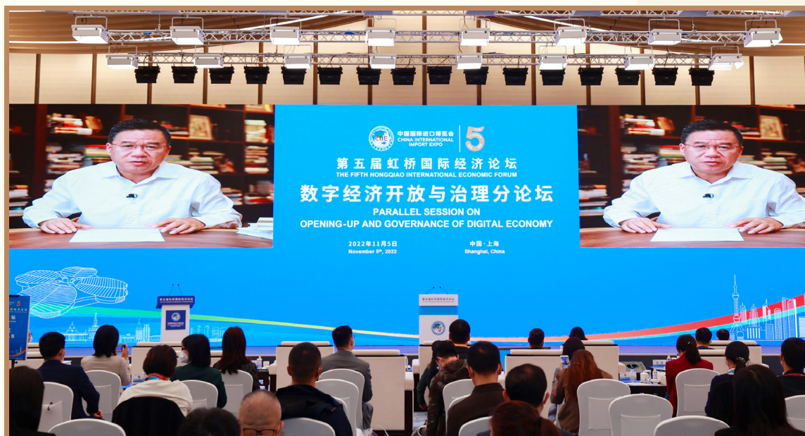
著名经济学家马光远