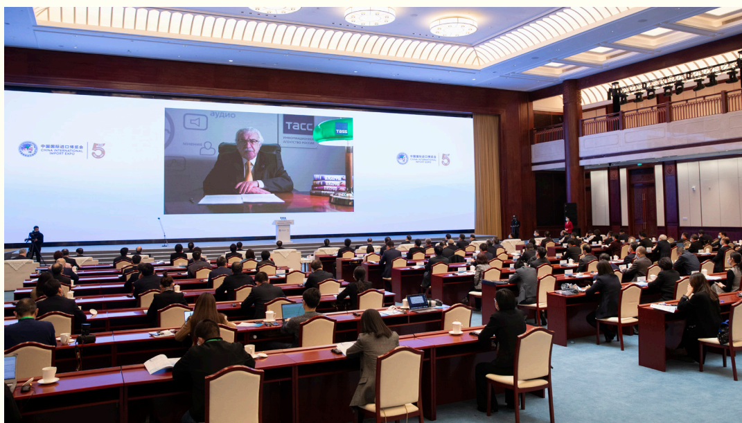
俄罗斯塔斯社第一副社长米哈伊尔·古斯曼 以视频方式出席“中国发展新蓝图与全球发展新机遇”分论坛并发言