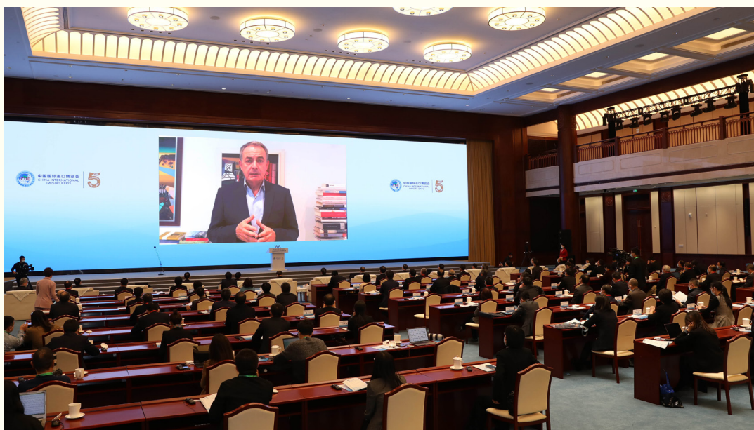
西班牙前首相萨帕特罗 以视频方式出席“中国发展新蓝图与全球发展新机遇”分论坛并致辞