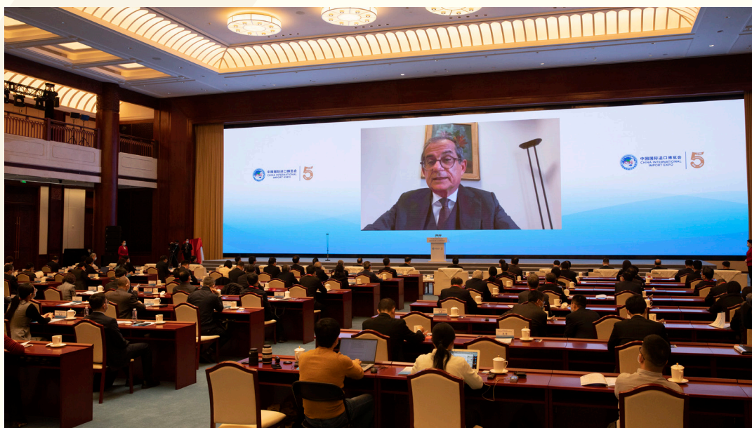
意大利经济和财政部前部长、国家行政学院前院长乔万尼·特里亚以视频方式出席“中国发展新蓝图与全球发展新机遇”分论坛并致辞