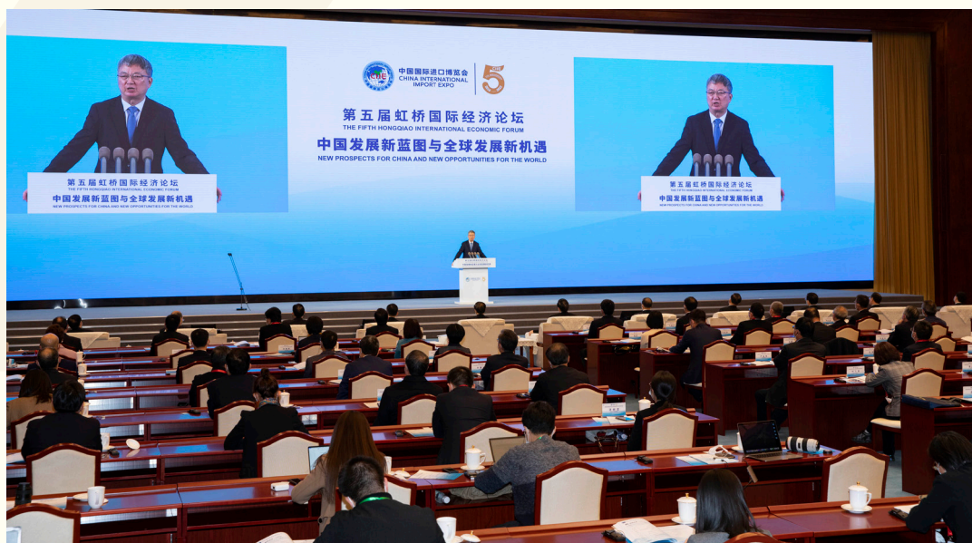
中国国际经济交流中心副理事长、中国人民银行原副行长朱民在北京出席“中国发展新蓝图与全球发展新机遇”分论坛并发言