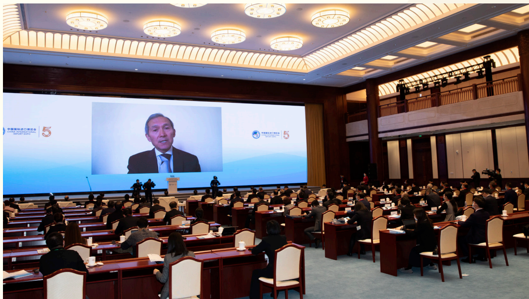
吉尔吉斯斯坦前总理卓奥玛尔特·奥托尔巴耶夫 以视频方式出席“中国发展新蓝图与全球发展新机遇”分论坛并致辞