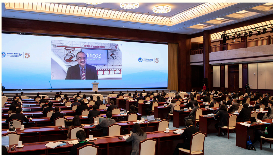
印孚瑟斯有限公司全球副总裁、中国区负责人沙睿杰 以视频方式出席“中国发展新蓝图与全球发展新机遇”分论坛并发言