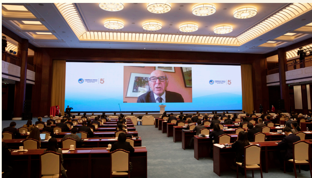
英国前商务大臣文斯·凯布尔以视频方式出席“中国发展新蓝图与全球发展新机遇”分论坛并致辞