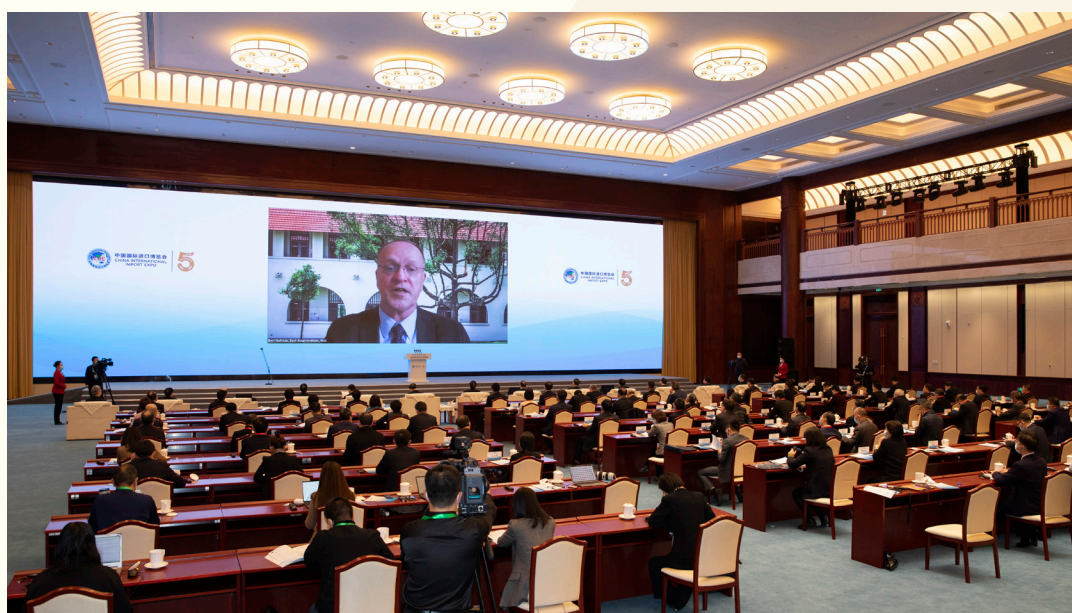
世界银行中国局前局长、新加坡国立大学东亚研究所所长郝福满 以视频方式出席“中国发展新蓝图与全球发展新机遇”分论坛并发言