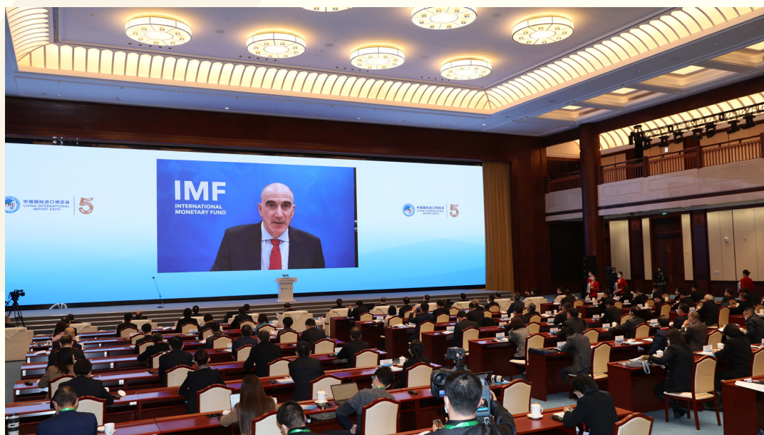
国际货币基金组织驻华首席代表史蒂文·艾伦·巴奈特 以视频方式出席“中国发展新蓝图与全球发展新机遇”分论坛并发言